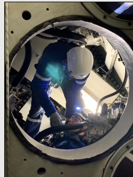
Resgate e evacuação no hub