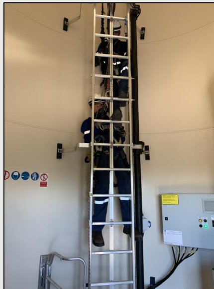
Resgate na escada