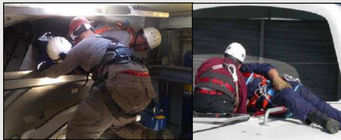
Fundação, nacelle e teto